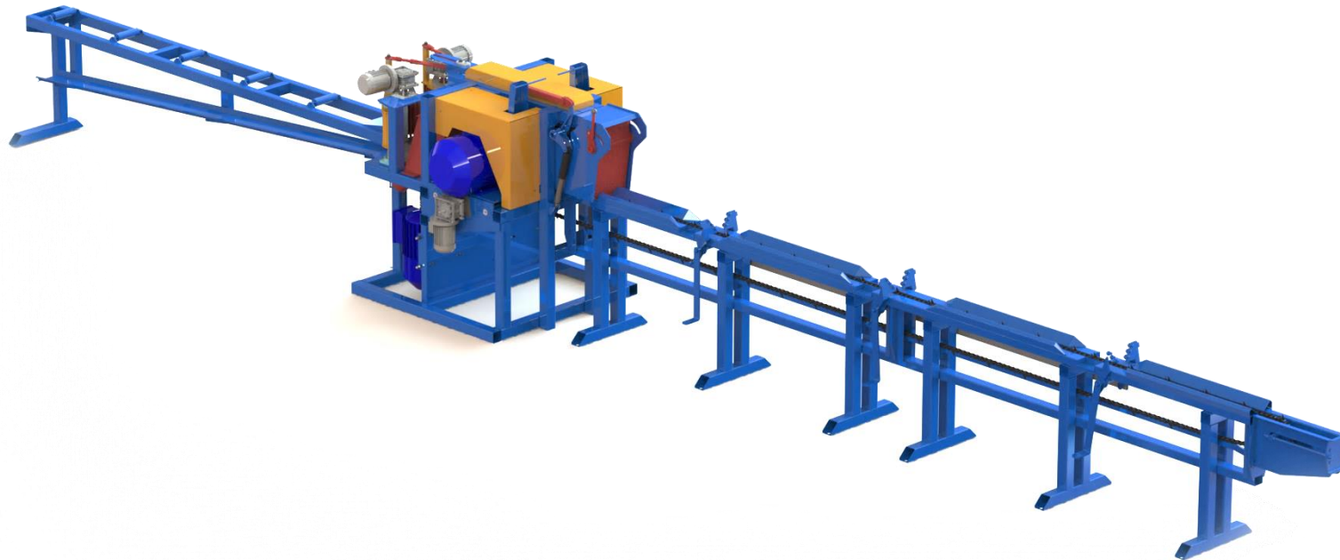
Фрезерно-брусующий станок «Алтай-ФБС01 СБ»